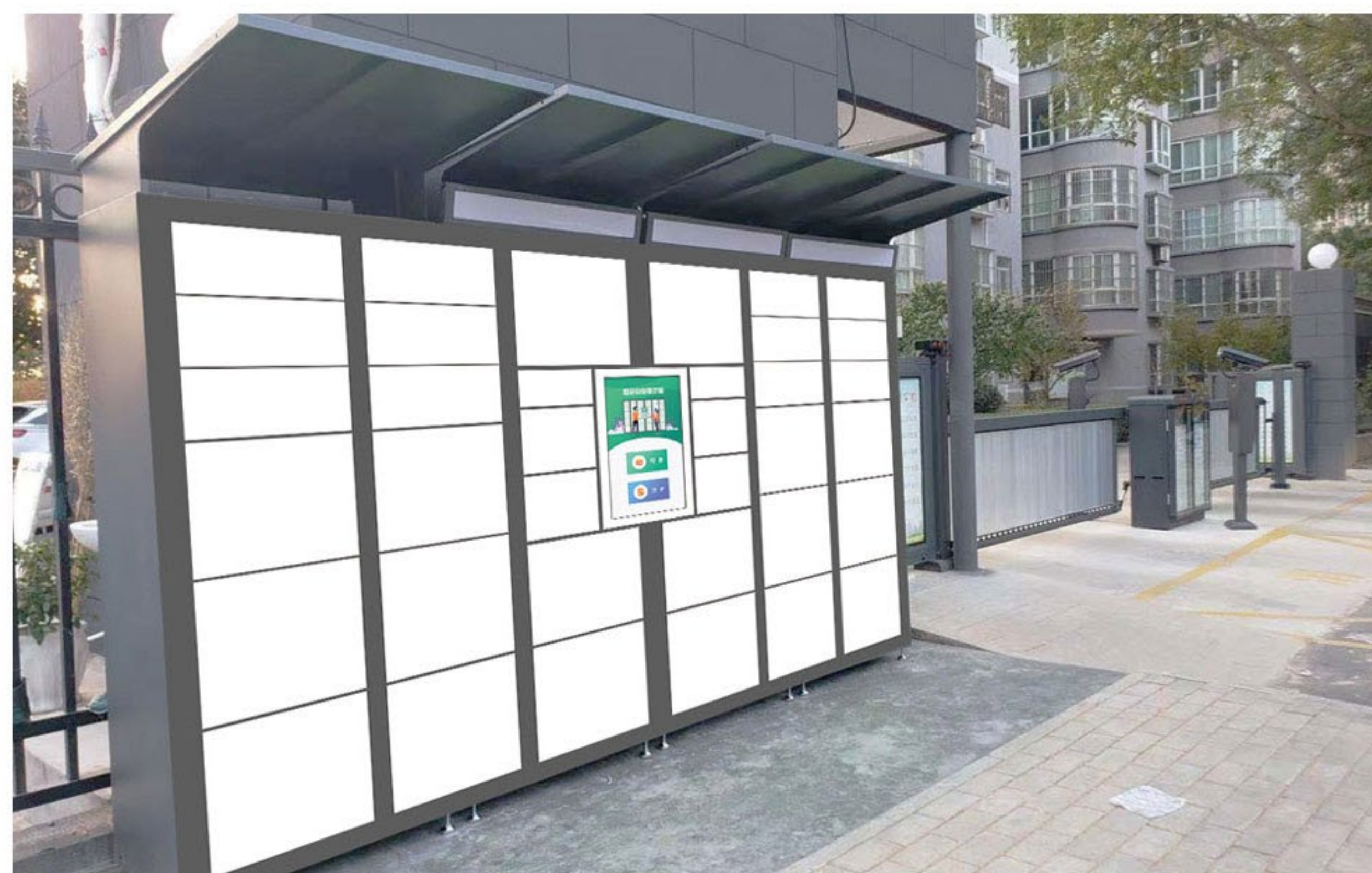
小区、生活超市等户外