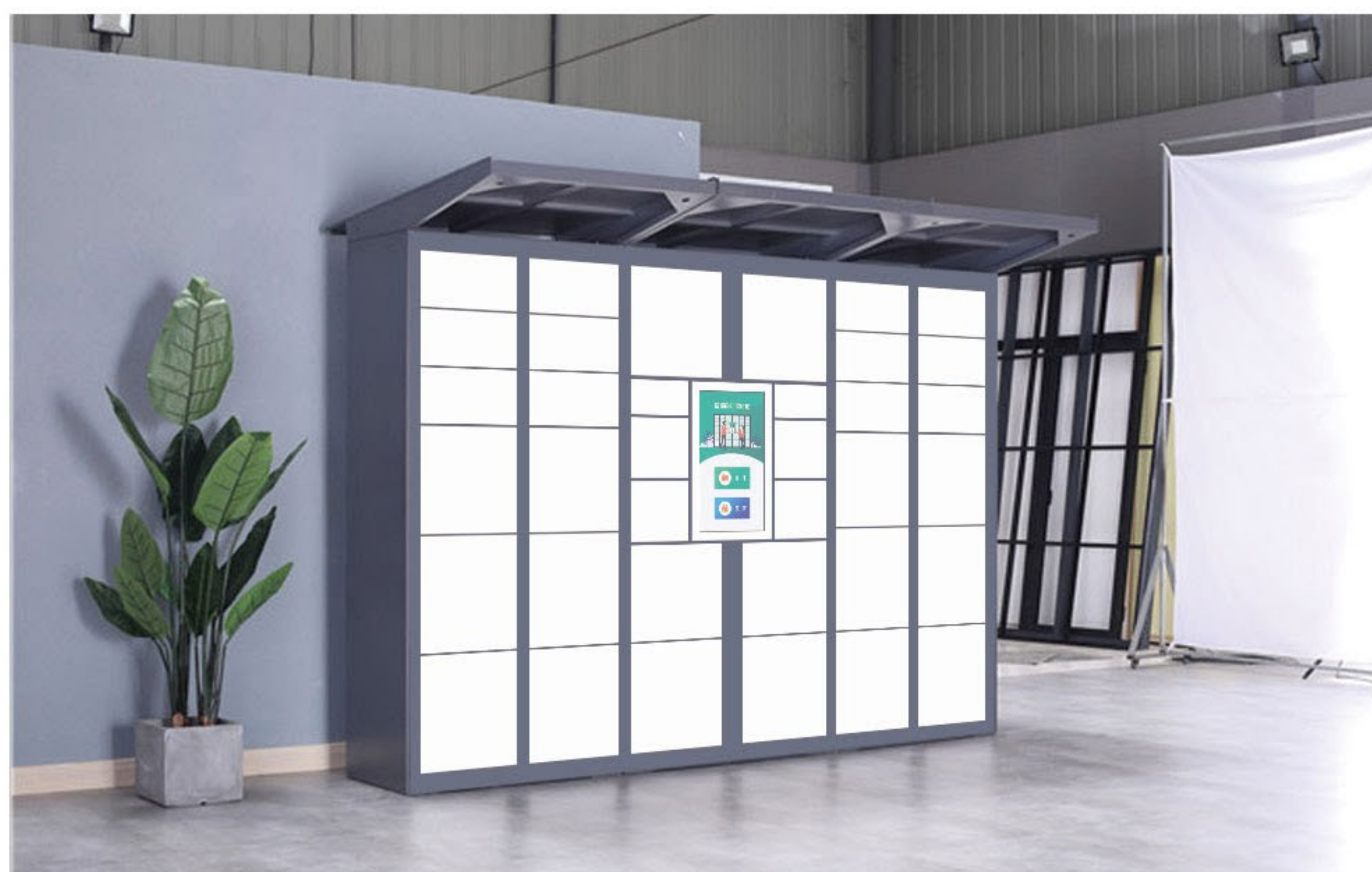
车间、厂房等活动大厅